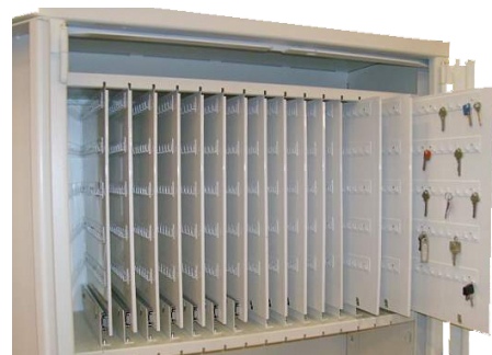
- utdragbara nyckelskivor 1885 krok (SÄK 1900-2)