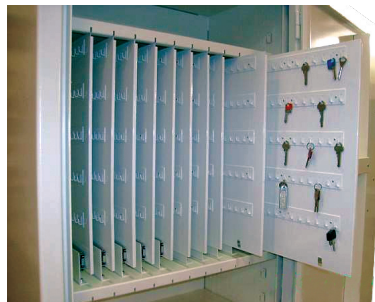
- utdragbara nyckelskivor 1235 krok (SÄK 1900)