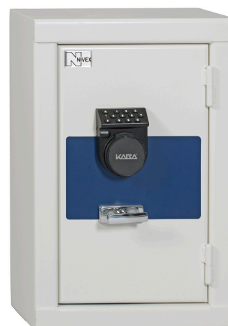
SÄK 107 Kaba-Mas 52 V