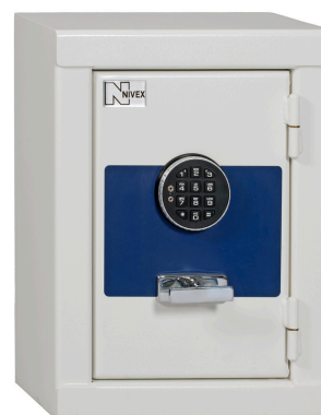
SÄK 42 La Gard